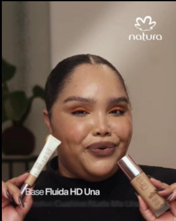
Base Fluida HD Una