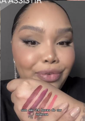
sim são 24 horas de cor intensa