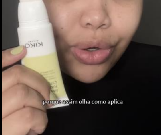
porque assim olha como aplica