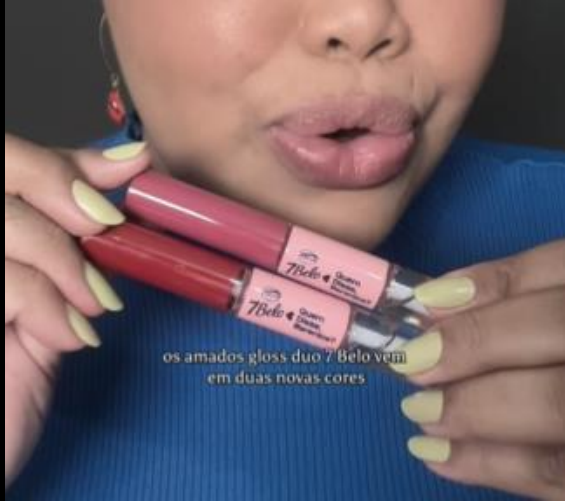
os amados gloss duo 7 Belo vem em duas novas cores