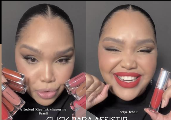
o Locked Kiss Ink chegou no Brasil